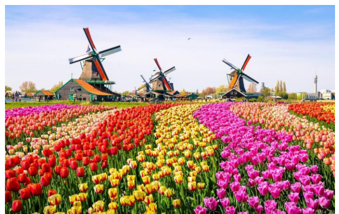
Champs de tulipes