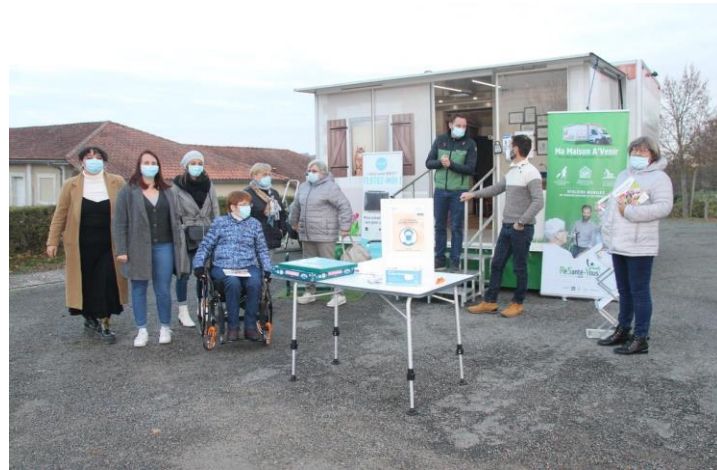
Le groupe devant « Ma Maison A venir » (Photos CL J Y DELAGE)

L'atelier « Objectif Equilibre » en partenariat avec SIEL BLEU s'est déroulé de septembre à décembre 2021 sur 15 séances à raison d'une heure par semaine en présence d'Ophélie, animatrice. Grâce aux différents mouvements de gymnastique douce (étirements, renforcement musculaire ...) nous avons pu renouer avec les différentes parties de notre corps et retrouver de la mobilité, tout ceci dans une ambiance conviviale en échangeant entre nous.