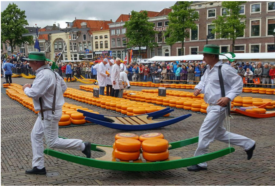
Marché de fromages à Alkmaar